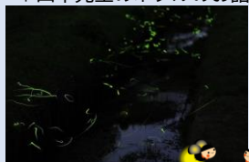
とても蛍がいっぱい！