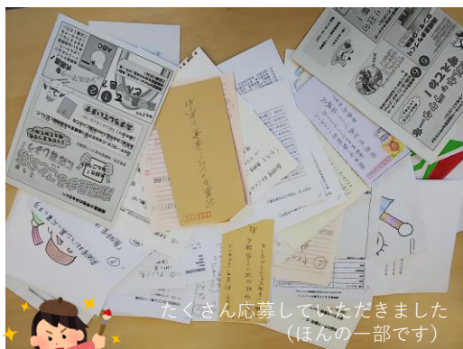
たくさん応募していただきました (ほんの一部です)

これから、サポーター事業企画グループメンバーにより整理を行い、外部審査員も加えて、作品の審査等を行うこととしています。