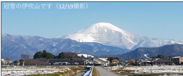
冠雪の伊吹山です (12/19撮影)

本年度は、コロナ禍によって予定していた事業などが中止や延期となり、予算の執行についても少々頭を抱える状況になっています。早く解放されたいなあ、あと、もう少し、頑張りたいです。