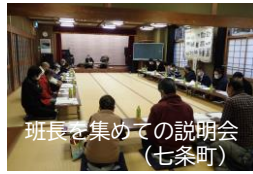
班長を集めての説明会(七条町)

議案書を事前に配布し、賛成反対の表決票を総会日に当てる日に集計し、議決するというものです。また、出席人数を少なくするため、住民の委任を受けた組長や役員の方だけが会館に参集されて総会をされるという方法です。 特に、今回の事態で悩まれたのは、役員選挙の方法をどうするかということのようでした。このような総会は今回限りになるというのですね。