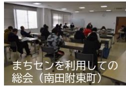
まちセンを利用した総会(南田附東町)