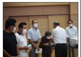
7/18地域福祉研修会で会長から手渡されました

このほど地協社会福祉部会では、南郷里地域で活動されている高齢者サロン二カ所に非接触式体温計をお渡しすることとしました。 これは、サロン参加者の検温に使っていただき、少しでも安心した環境でサロン活動に取り組んでいただくことを願うための対応です。